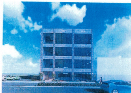
建物イメージバス